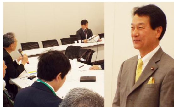
製造業にたずさわる中小企業経営者の皆さんと、政策立案の専門家から自動車産業の今後について説明を受けました。現場の声を聞きながら、先手を打った中小企業政策を提案していきます。

雇用の変化では生産年齢人口の減少以外にもパート・アルバイト・派遣・契約・嘱託といった非正規労働者の比率が男女および各年齢層ともに上昇しています。