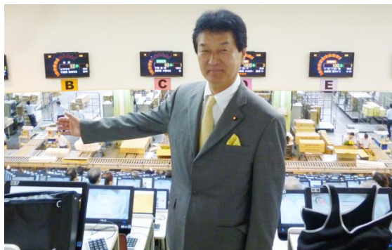
大田花卉市場を花卉産業振興議員連盟の役員として視察いたしました。日本で一番扱い額が大きい花の市場です。今、多くの農家の皆様から丹精込めた作物を出荷しています。今後も「地元密着」で産業振興に努めて参ります。

そうしたことも含めて、労働法別に均等・均衡待遇の規定を織り込むなど新しい時代に合った雇用環境を整える政策を進めます。