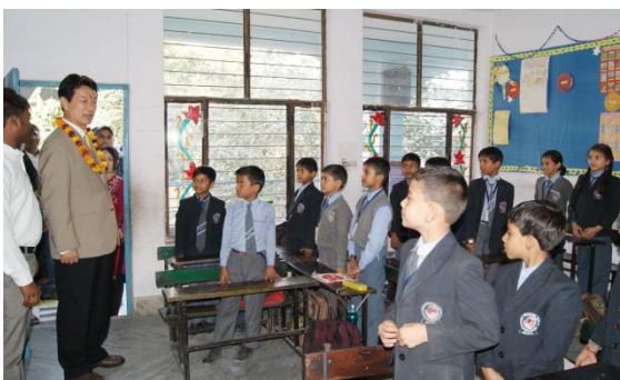
インドに出張して、小中高一貫の私立学校を訪問しました。海外青年協力隊の女性隊員が日本語を教えています。中学校までは日本語が必須です。授業料は月1500円で、中流層のご家庭の子供達が多いそうです。日本への期待を実感します。